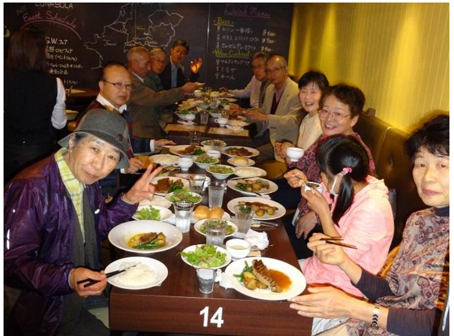
レストランでステーキをいただきました