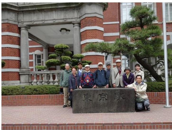
東京駅（中央）で記念撮影