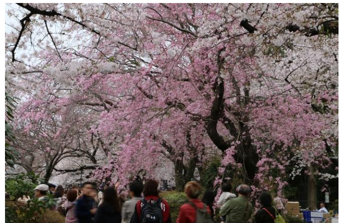
満開の桜を楽しむ花見客