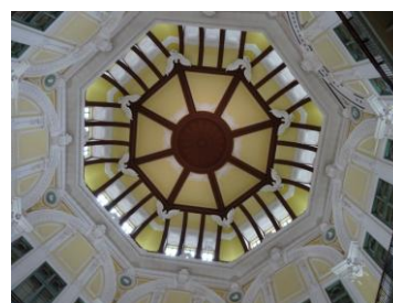
東京駅南口 ドーム天井