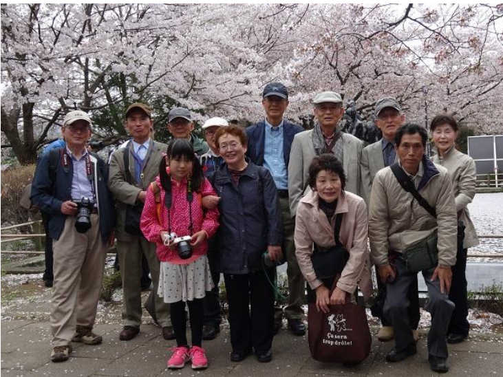
モニュメント前で記念撮影