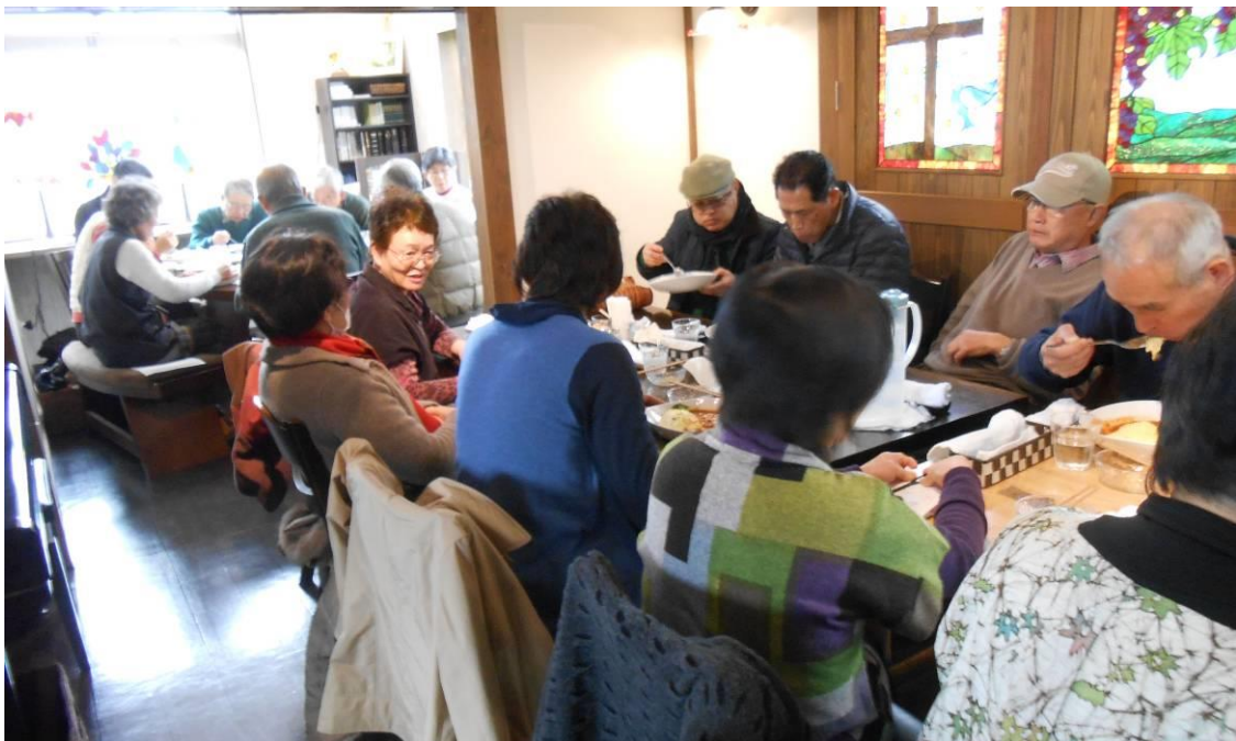
話が尽きない カフェ「けやき」