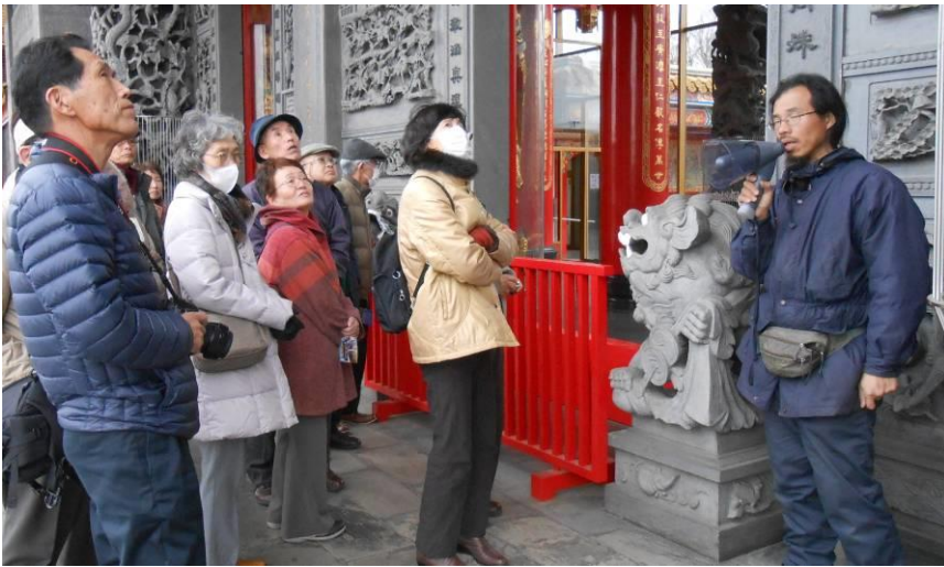
案内人の話を聞く面々