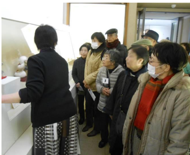
雛の歴史に聞き入る仲間