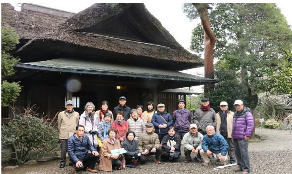
遠山記念館の玄関にて