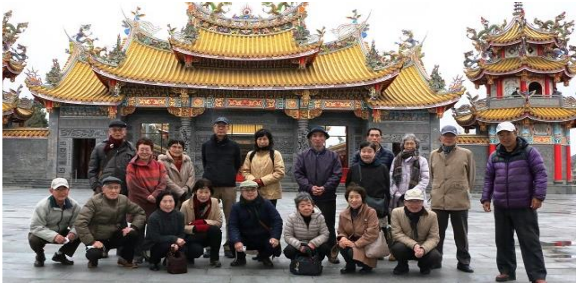
聖天宮の前殿の広場にて