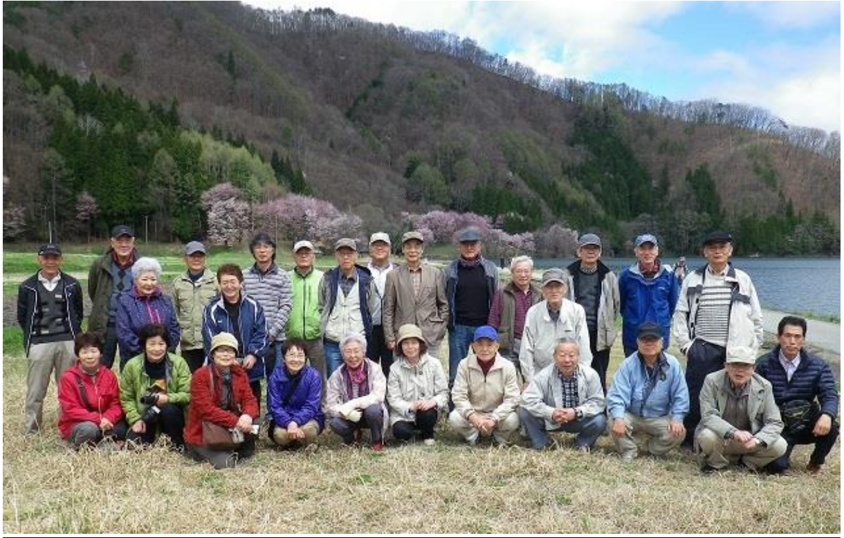
絵がこう 25、虹の会、それいゆ、オーロラ会の皆さん（後は中綱湖と桜）

1日目の写生場になった東武湯の丸IC近くの「雷電クルミの里」道の駅からの眺望 高速道路側