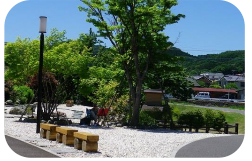
東屋の対岸から堰を望む